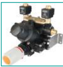
Valvola di regolazione manuale serie 457 Manual control unit with solenoid valves