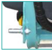
Attacco terzo punto Three point coupling