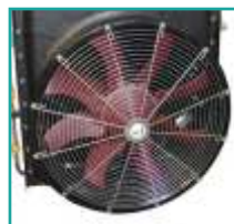
Ventola Fan unit