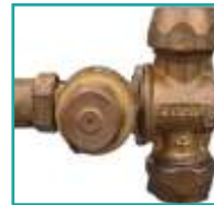
Doppi ugelli in ottone Double brass nozzles