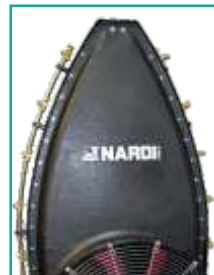
Poliestere deflettore Polyester deflector panel