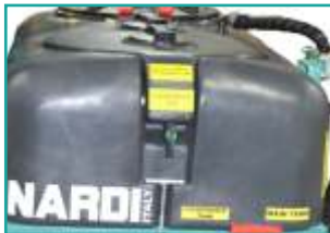
Circuito lavaggio serbatoio Hand and circuit washing tank