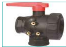
Valvola a sfera Ball valve