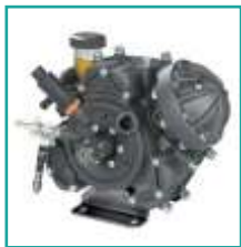
Pompa a diaframma APS71 Diaphragm pump APS71