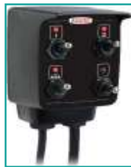
Scatola di comando Control box